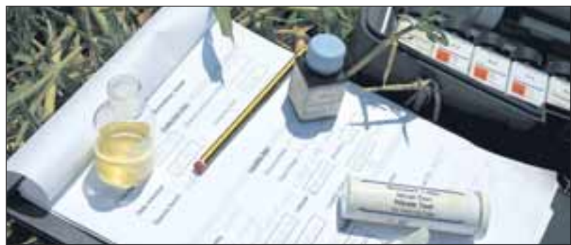
Auf Datenblättern werden die Umweltbedingungen exakt notiert.