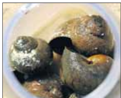
Einige Arten gibt es nur in Malawi.