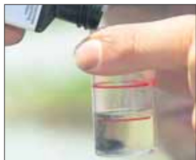
Wasseranalyse vor Ort.

Drei Tümpel und zwei Flüsse stehen heute noch auf dem Plan. Es wird knapp. Um 18 Uhr ist es am Äquator schon fast dunkel. Dann noch durch Buschland und Sümpfe zu waten, da hört selbst Rolands Begeisterung für Schnecken auf.