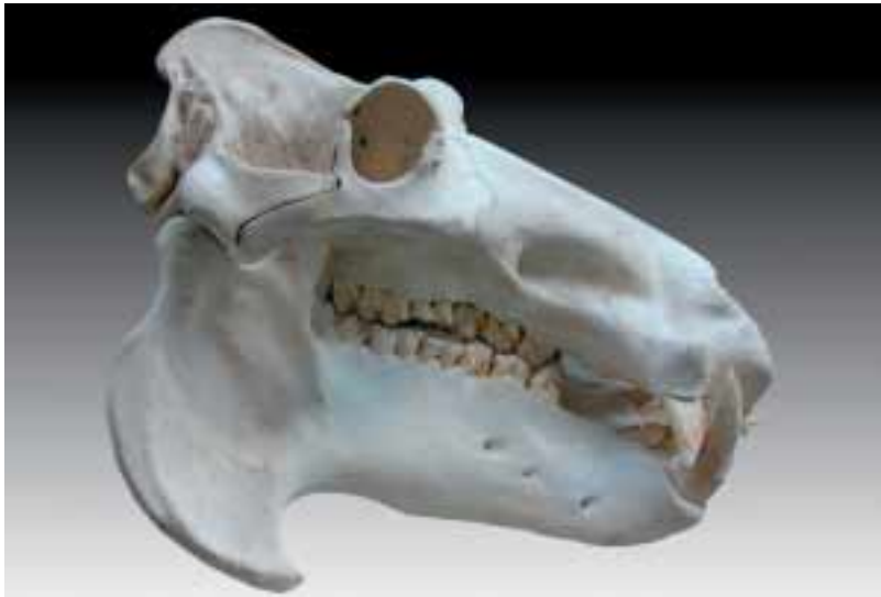
Abb. 2: Fossiler Schädel eines Flusspferdes mit etwa 15 Zentimeter langen Eckzähnen. Die Isotopensignatur des Zahnschmelzes kann als geochemischer Tracer für Paläoklima und Nahrung des Tieres dienen.

Diese Aufzeichnungen liefern Informationen über Bewegungen und Aufbau der Erdkruste. Mainzer Geochemiker werden mit Frankfurter Paläontologen in einer gemeinsamen Geländekampagne auf die Suche nach geeignetem fossilem Material gehen, bei dem die ursprünglichen geochemischen Signaturen über geologische Zeiträume hinweg erhalten geblieben sind und damit Aussagen zum Paläoklima ermöglichen (Abb. 2).